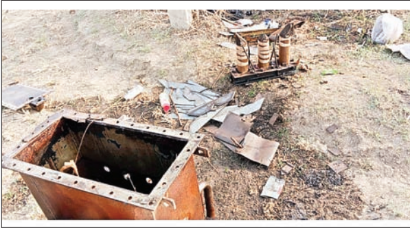
మంగపేట మే25, ప్రభాతవార్త.